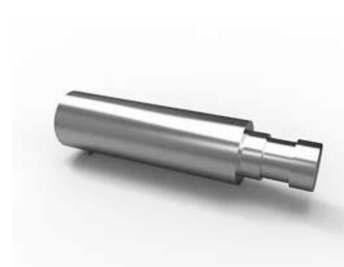
prodloužení držáku 20-5100-NF ks 90 Kč