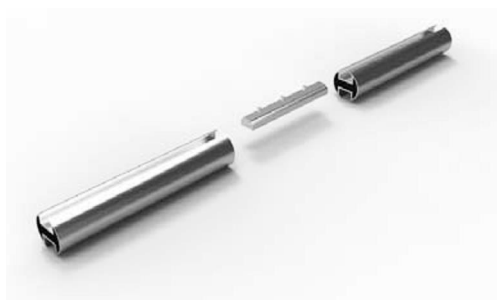
spojka profilů 20-1102 ks 100 Kč