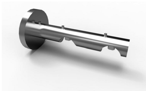
dvoudržák 20-2600-NF ks 170 Kč 20-2620-NF pár 320 Kč