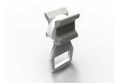
jezdec s teflonem 30-015 10 ks 20 Kč