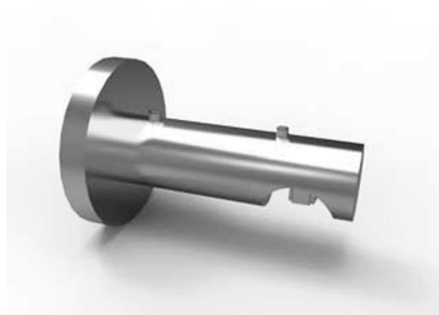
jednodržák 20-0600-NF ks 150 Kč 20-0620-NF pár 280 Kč