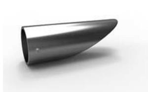
koncovka Klínovec 80 x 24 mm 20-0036-NF pár 150 Kč