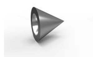
koncovka Ještěd 36 x 36 mm 20-0037-NF pár 150 Kč