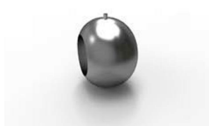
koncovka Říp 28 x 31 mm 20-0034-NF pár 150 Kč