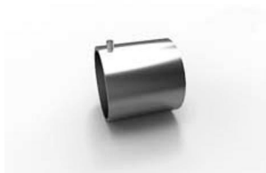
koncovka Váleček 18 x 25 mm 20-0030-NF pár 110 Kč