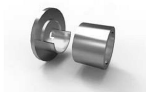
stěnový držák 39 x 23 mm 20-5000-NF ks 140 Kč